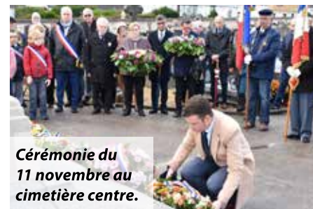
Cérémonie du 11 novembre au cimetière centre.

petit, se transforme en haine... A nous élus d'être présents pour écouter et agir, pour transformer la colère en espoir, et faire que la mobilisation devienne une force pour l'action politique !»