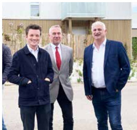
Le député Edouard Bénard (ici à gauche) lors de l'inauguration des bâtiments rénovés à Saint-Julien le 2 juillet dernier, aux côtés du maire de Saint-Etienne-du-Rouvray Joachim Moysse et du maire d'Oissel Stéphane Barré.

A rrivé largement en tête du 1 er tour des élections législatives anticipées (48,64 %), Edouard Bénard a été réélu député de la 3 e circonscription de Seine-Maritime le 7 juillet dernier, réunissant au 2 nd tour 66,88 % des suffrages.