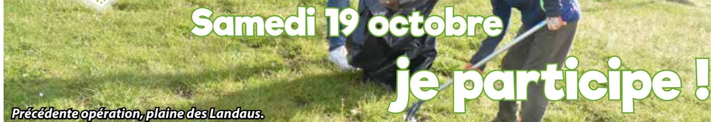
Précédente opération, plaine des Landaus.