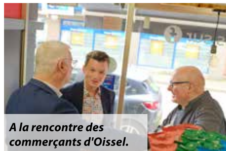
A la rencontre des commerçants d'Oissel.

«Les inégalités sont de plus en plus flagrantes... C'est choquant. Il y a un seul gâteau, et si certains ont une plus grosse part de celui-ci, d'autres en auront forcément une plus petite ! Un meilleur partage des richesses est possible.»