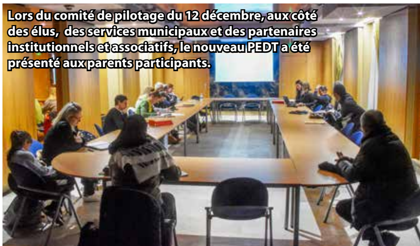
Lors du comité de pilotage du 12 décembre, aux côtés des élus, des services municipaux et des partenaires institutionnels et associatifs, le nouveau PEDT a été présenté aux parents participants.