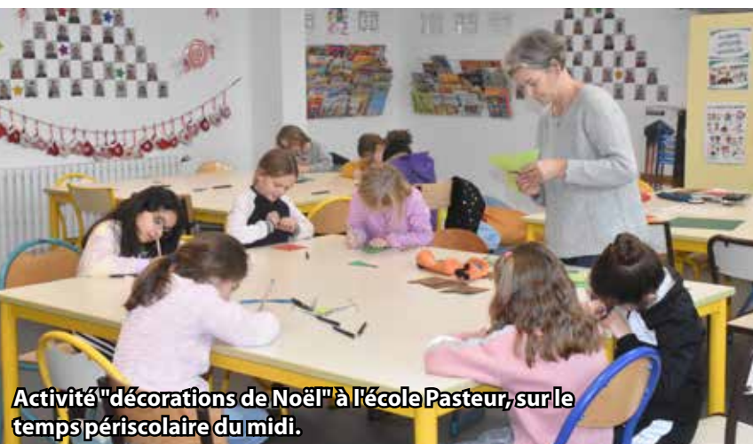
Activité "décorations de Noël" à l'école Pasteur, sur le temps périscolaire du midi.