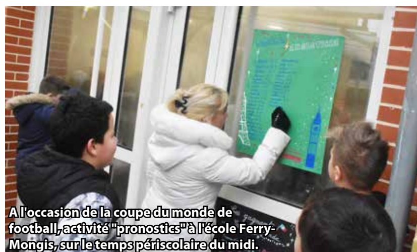
A l'occasion de la coupe du monde de football, activité "pronostics" à l'école Ferry-Mongis, sur le temps périscolaire du midi.