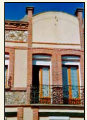
Le café des sports transformé en habitation.