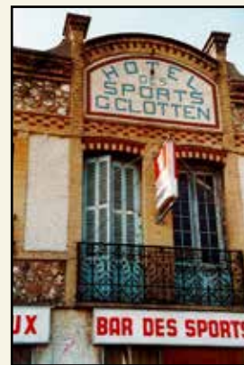
Le café des sports rue du Maréchal-Foch avant 2002.