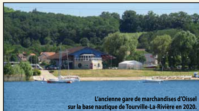
L'ancienne gare de marchandises d'Oissel sur la base nautique de Tourville-La-Rivière en 2020.