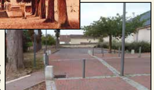
Aujourd'hui, l'emplacement du kiosque est transformé en parking de la mairie.