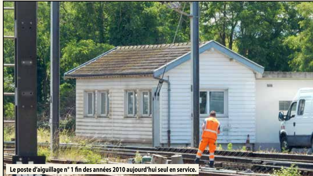
Le poste d'aiguillage n° 1 fin des années 2010 aujourd'hui seul en service.

Aujourd'hui, c'est à partir du poste d'aiguillage n°1 situé entre la gare et le pont passant sur la Seine que le trafic est régulé.