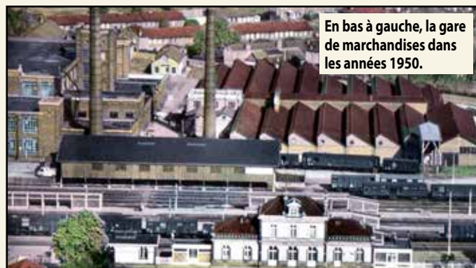
En bas à gauche, la gare de marchandises dans les années 1950.