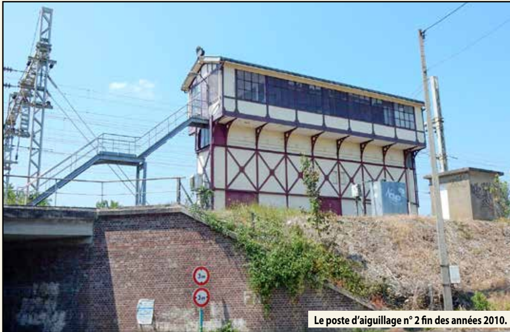
Le poste d'aiguillage n° 2 fin des années 2010.