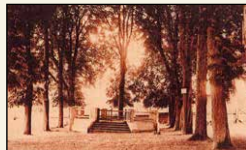
Le kiosque à musique jusqu'aux années 1990. On appelait l'ensemble Salle verte.