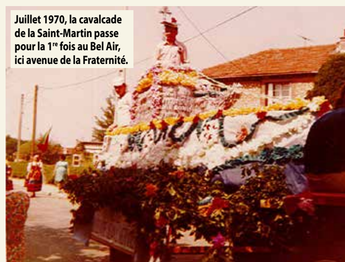
Juillet 1970, la cavalcade de la Saint-Martin passe pour la 1 re fois au Bel Air, ici avenue de la Fraternité.